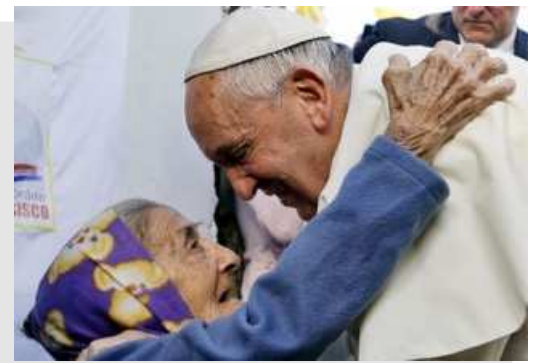
Pape François Angelus, 3 juillet 2016

Prions le Seigneur, par l'intercession de la Vierge Marie, afin que ne manquent jamais à l'Église des cœurs généreux qui travaillent pour apporter à tous l'amour et la tendresse du Père céleste.